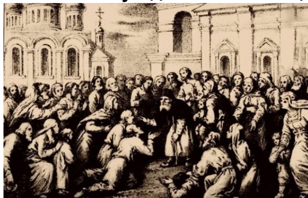
Преподобный Серафим благословляет народ

основанном им женском Дивеевском монастыре. В монастырь поступали девушки-сироты, а также те, кто искал высокой и богоугодной жизни под руководством батюшки Серафима. Святой направлял жизнь обители, следуя благословениям Божией Матери. Незадолго до кончины святого его в двенадцатый раз посетила Пресвятая Богородица. Это было в присутствии одной из дивеевских сестер. Вдруг сделался шум, подобный ветру заблистал свет, слышалось пение. Келлия старца чудно преобразилась: она словно раздвинулась, потолок исчез и вверху было одно сияние. А затем явилось чудесное шествие: шла Богоматерь в сопровождении двенадцати святых дев, Иоанна Богослова и Иоанна Предтечи; впереди шли два Ангела с цветущими ветвями в руках. На Царице Небесной была сияющая, несказанной красоты мантия, голову венчала дивная корона. Старец на коленях встречал Владычицу неба и земли. Мать Божия обещала святому не оставлять дивеевских сестер Своей помощью.