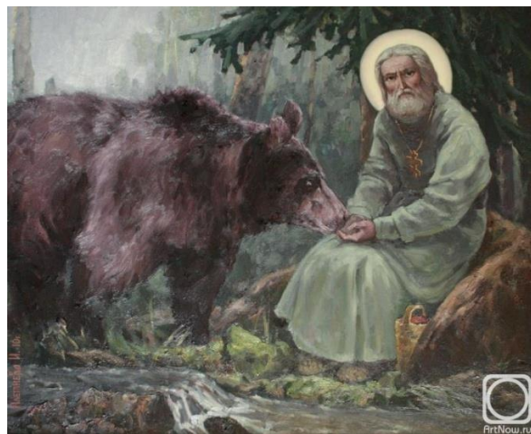
Медведь питается из рук прп. Серафима . Картина И. Плетневой

Но самое главное, люди находили путь спасения души и учились восходить к Богу через любовь и послушание Сыну Божию, Господу нашему Иисусу Христу. Это главное, чему учил преподобный Серафим. Батюшка Серафим оставил православным людям замечательное учение о спасении. “Истинная цель нашей христианской жизни, — говорил он, — состоит в стяжании (приобретении) Духа Святого. Пост же, бдение, молитва и добрые дела суть лишь средства для стяжания Духа”. Стяжание означает